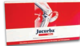
Jucurba® 240 mg 2 x tägl. 2 Hartkapseln