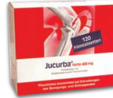
Jucurba® forte 480 mg Nur 2 x tägl. 1 Filmtablette